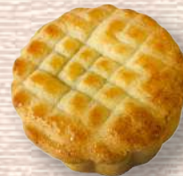
紅豆一奶黃菠蘿包月餅